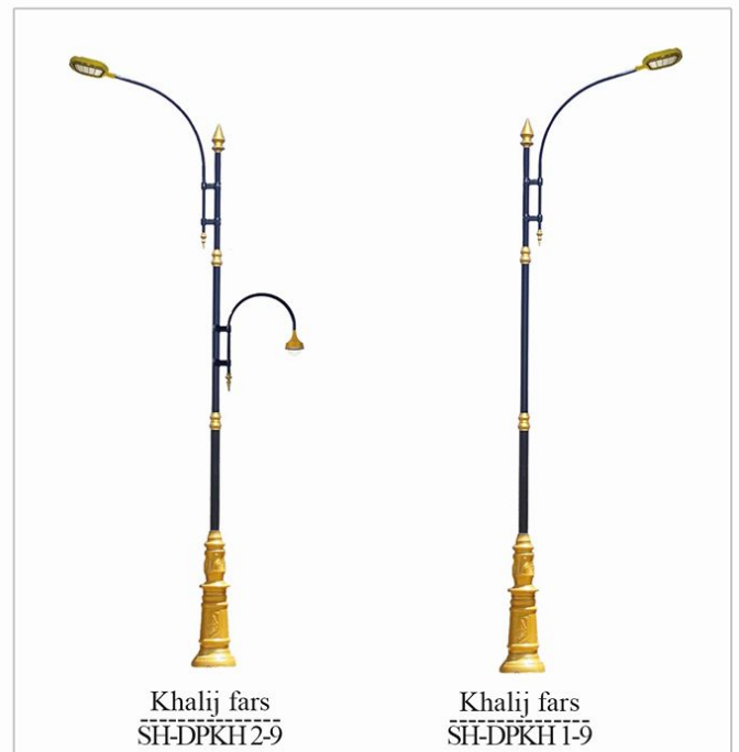
Khalij fars SH-DPKH 2-9